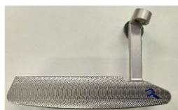
SQUARE BLADE DEEP MILLED Wt 317.0g